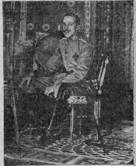
ALFONSO, REY DE ESPAÑA, QUIEN RENUNCIO AL TRONO

BARCELONA, 14. — Tras las proclamas de la República Catalana, centenares de personas invadieron el Palacio del Gobierno Provincial, rompiendo los retratos del Rey, que fueron arrojados a la calle y quemados. Un oficial del ejército que pasaba fué detenido por la multitud y obligado a vivir la República, lo que hizo pidiendo que no se usara la violencia, pues era republicano. La multitud le ovacionó. La noticia de la proclamación de la República se extendió rápidamente por la ciudad, siendo recibida con enorme entusiasmo. Todas las calles se llenaron inmediatamente de gentes que vivaban a la República, dirigiéndose al Ayuntamiento. La policía hizo algunas cargas, pero al saber la renuncia del Alcalde interino de esta ciudad, permaneció pasiva. Mensajes recibidos