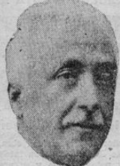
NICETO ALCALA ZAMORA, jefe de los republicanos españoles y actual jefe del gobierno provisional

Se ha formado un nuevo gabinete bajo la jefatura de Alcalá Zamora, e integrado en la siguiente forma: hacienda, García Prieto; estado, Lerroux; justicia Fernando de los Ríos; fomento, Alborno; guerra, Azaña; marina, Gomes Miranda; interior, Miguel Maura; trabajo, Largo Caballero; comunicaciones, Martínez Marros